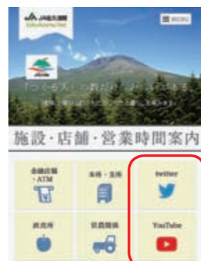
スマートフォン用画面

J A佐久浅間の公式ホームページから公式SNSがご覧いただけます。バナーをクリックして、ツイッターの投稿やユーチューブの動画をお楽しみください。フォロー、チャンネル登録よろしくお願ひします！