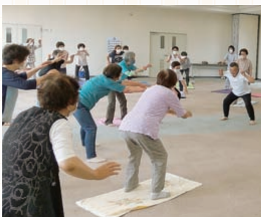
38人が参加した6月のストレッチ教室。2回目は12月に開催予定。