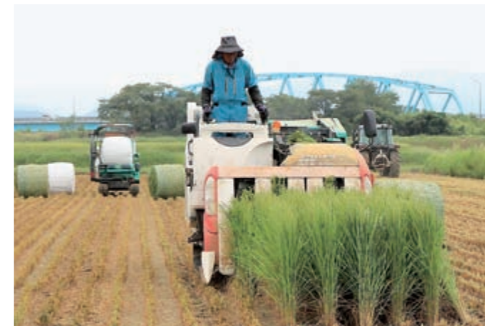
専用の収穫機による刈り取り作業