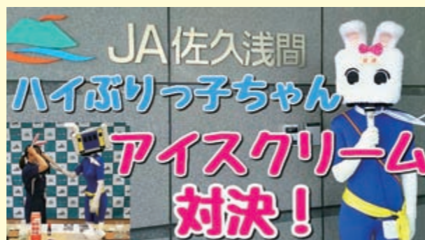
牛乳を使ったアイスクリームづくりで職員と対決

佐久市のご当地ゆるキャラ「ハイぶりっ子ちゃん」とのコラボ動画が6月からスタート。当JA常勤役員をはじめ、職員が出演しています。