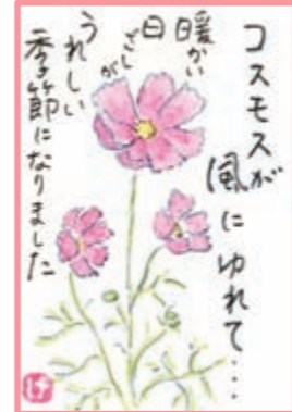
K・ばあば (御代田町)

今 年は新型コロナウイルスの影響でか小鮎が出回っていない。やつと手に入った小鮎だったのでゆつくりと甘露煮にして食べていた。終わるころ親戚から1キロいたたいて、またゆつくりと煮て食べていたころ、またもや嫁に行つた娘から今度は煮た鮎を1パックいたたいて本当に今年運がいい。甘露煮は骨まで食べられてカルシウムがたくさん含まれているので夫とともに骨を丈夫にしたいので、うれしいかぎりでした。 M・K (佐久穂町)