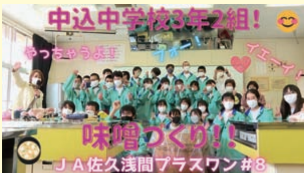
中込中学校の味噌づくりに密着