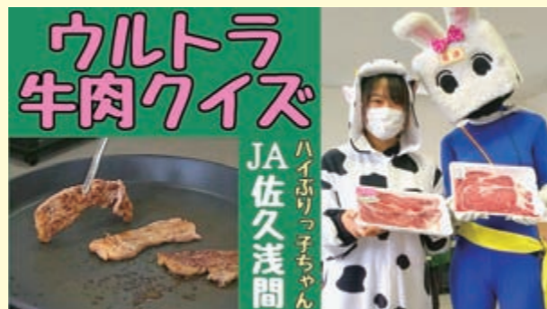
地元産牛肉をかけて浅沼組合長とクイズ対決

●紹介した動画を含め、これまでに 17 本を配信しています。※令和3年9月末現在