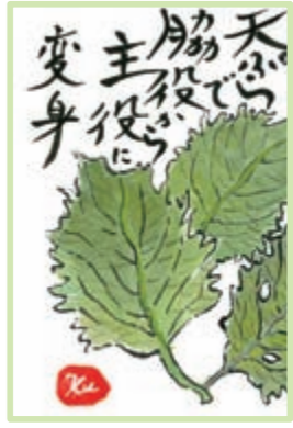
ピー子ちゃんママ (佐久市)

今 年は雨が多く秋の野菜の種をまいて水やりをしなくても一列に青々とした菜っ葉類が元気に芽を出してくれ、毎朝ながめては満足しています。でもこれからは手を加えて育てては。 田舎のばーさん (立科町)