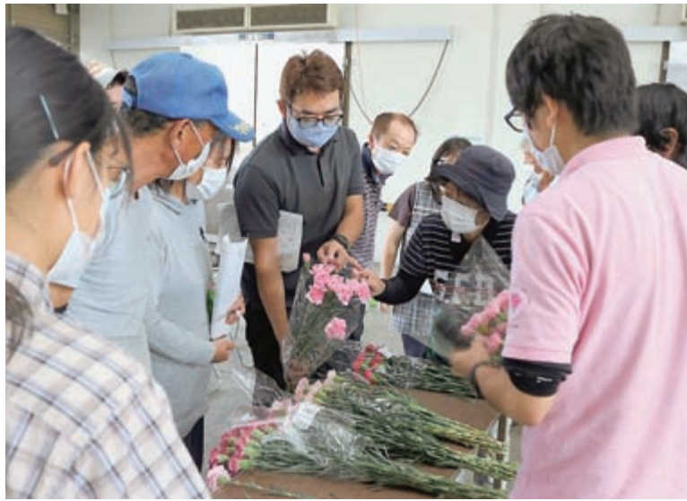
規格を確認する部会員ら