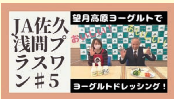
望月高原ヨーグルトをPR

佐久ケーブルテレビとの共同制作動画。地元農産物のPR、旬の食材を使った料理の紹介、女性会活動などを配信しています。