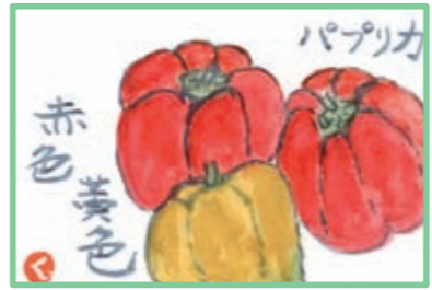
ブルーン (御代田町)

毎 年一輪か二輪しか咲かない月下美人が、今年は一夜に四輪も開いて美しくみごとでした。妹夫婦も呼んで一杯しながら開いていく様子を楽しみました。次の夜、他の一輪も開き、一年間ずっと世話をした主人に感謝です。 百目草 (佐久市)