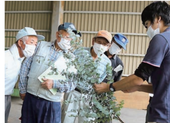
規格を確認する生産者