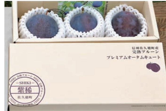
ブランド化したブルーベリー「紫稀～SHIKI～」