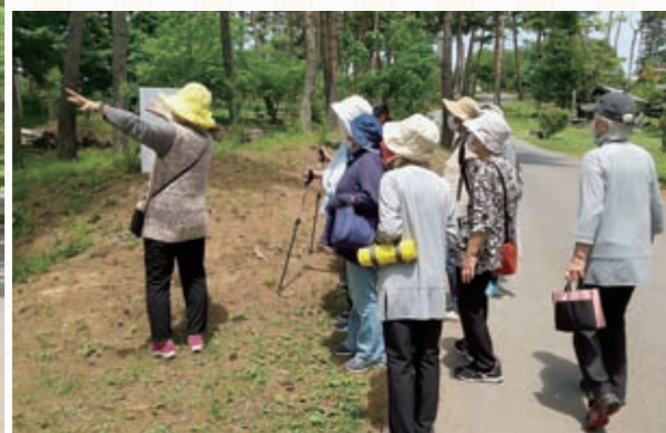
晴天の下、久しぶりの活動となるウォーキングを楽しみました。