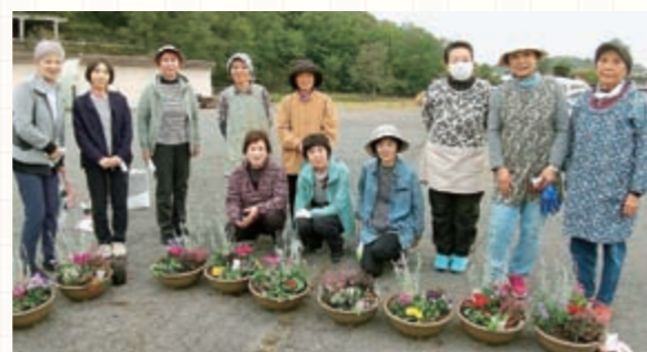
10月27日には寄せ植え講習会を開催。花の組み合わせなどを工夫しながら楽しみました。

北御牧支部は5班40人のこじんまりしたまとまりの良い支部です。コロナ禍で集まる機会が減る中、仲間との親睦を図ろうと、6月7日に東御市八重原の明神池周辺を散策しました。池を中心に芸術むら公園が整備され、最高の天気の下で珍しい花や実があると名前を調べたりと豊かな自然を満喫。久しぶりに会った仲間とマスク越しに元気な姿を確かめ合い「またやりたいね」と約束し、有意義なウォーキングとなりました。