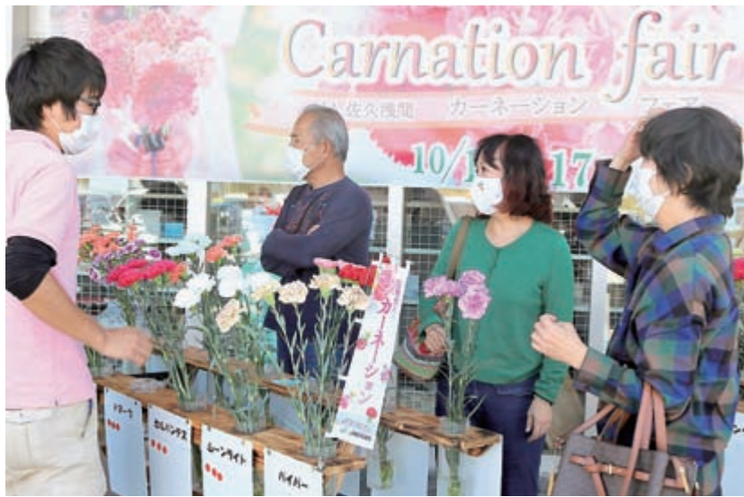
大勢の来場者で賑わったカーネーションフェア