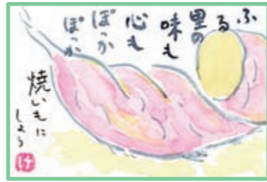
K・ばあば (御代田町)

実 家にブルーノンの木が何本もありますが、出荷せずに木で完熟させて近所に配ったり、親戚に送ったりしています。我が家でもたくさんもらい、職場の仲間にもあげると皆、甘くておいしいと大喜びです。兄夫婦に感謝。 ヌイ・ヌイ (佐久市)