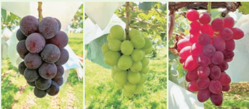
ナガノパープル シャインマスカット クイーンルージュ®

J A全農長野は今年デビューした「クイーンルージュ®」（品種名「長果G11」）を含む色違いのブドウ3つの品種を「ぶどう三姉妹」と名付け、売り込みを始めています。