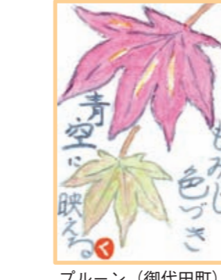
ブルーノン (御代田町)

先 日、ほぼ2年ぶりに娘が帰省し、やっと久しぶりに会うことができ、うれしかったです。あれもこれも食べさせたいと、頭の中は食べ物のことばかりでした！ へのかっぱ (佐久市)