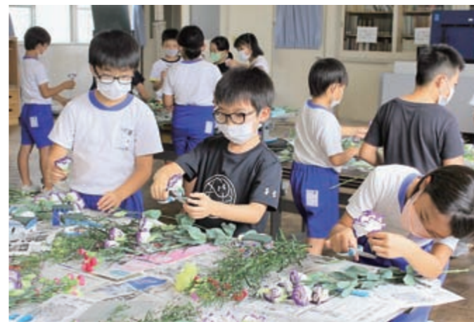
フラワーアレンジメントを楽しむ児童