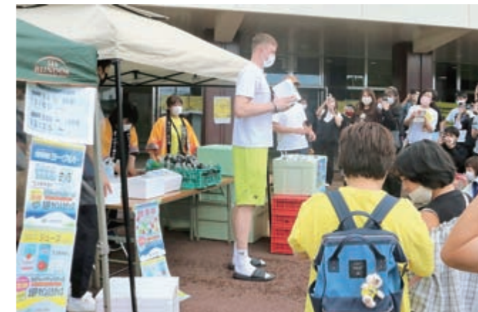
ヨーグルトセットをPRするホーキンソン選手