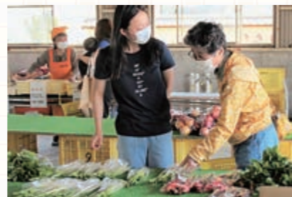
野菜を買い求める利用者

10月からは越冬野菜の販売も始まります。今年は11月26日(土)まで毎週火・木・土曜日に営業しています。お近くにきた際はお立ち寄りください。