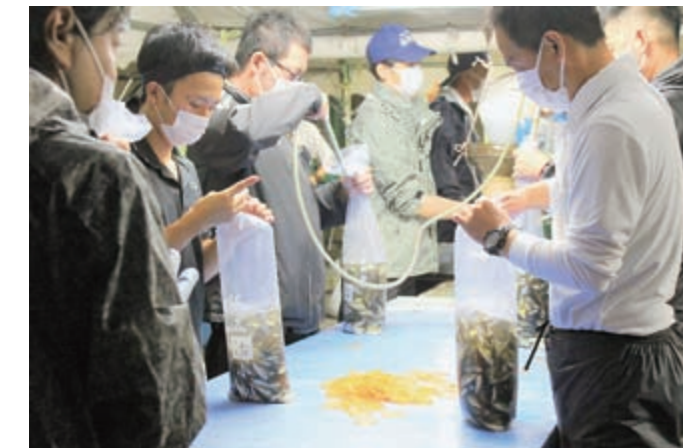
袋詰め作業をする職員