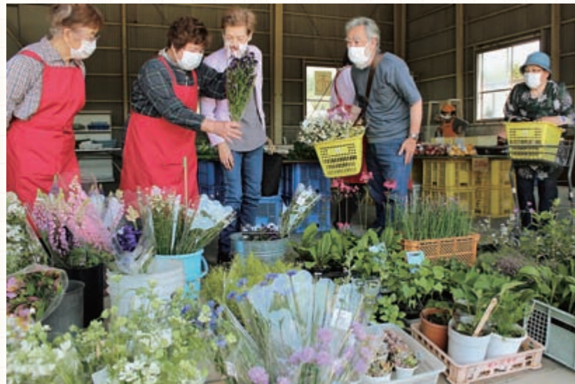
オープン初日の様子

JA女性会御代田直売所は、旧JA三ツ谷集荷所で安心安全で新鮮な野菜、花等を販売し、生産者と消費者の出会いや交流を定着させ地域農業に対する理解と魅力ある地域社会を形成することを目指しています。直売所の最大のイベントは、お盆の花市です。安くて新鮮なので大勢のお客様に喜ばれました。