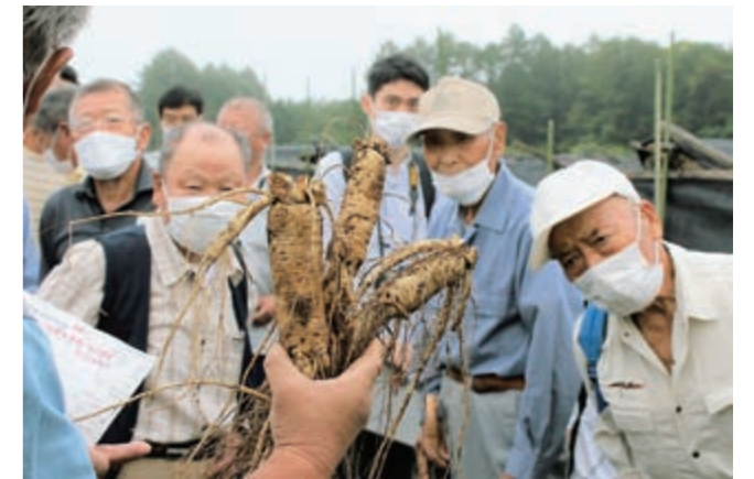
「信州人蔘」の出荷重量などを確認する生産者