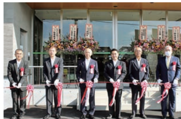
テープカットをする浅沼組合長ら関係者