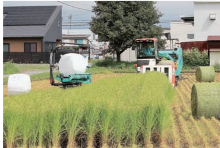
専用収穫機でのWCS用稲の刈り取り作業