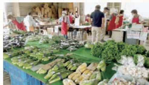
店頭に並ぶ新鮮な野菜