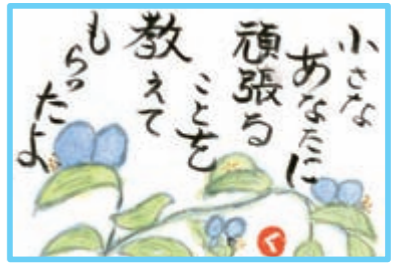
ブルーン (御代田町)

ア サマ20000に行く途中、車を停めて佐久平を一望しました。一面黄金色に彩られたいよいよ稲刈りのシーズンになると感じました。